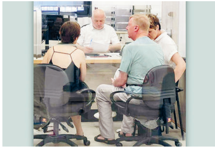
Анатолий Чубайс оформляет израильское гражданство.

Самое строгое наказание Чубайс понес в 1996-м, когда президент Ельцин решил свалить на него все грехи команды лжеформаторов и уволил Анатолия Борисовича с должности первого вице-премьера. Тогда появи-