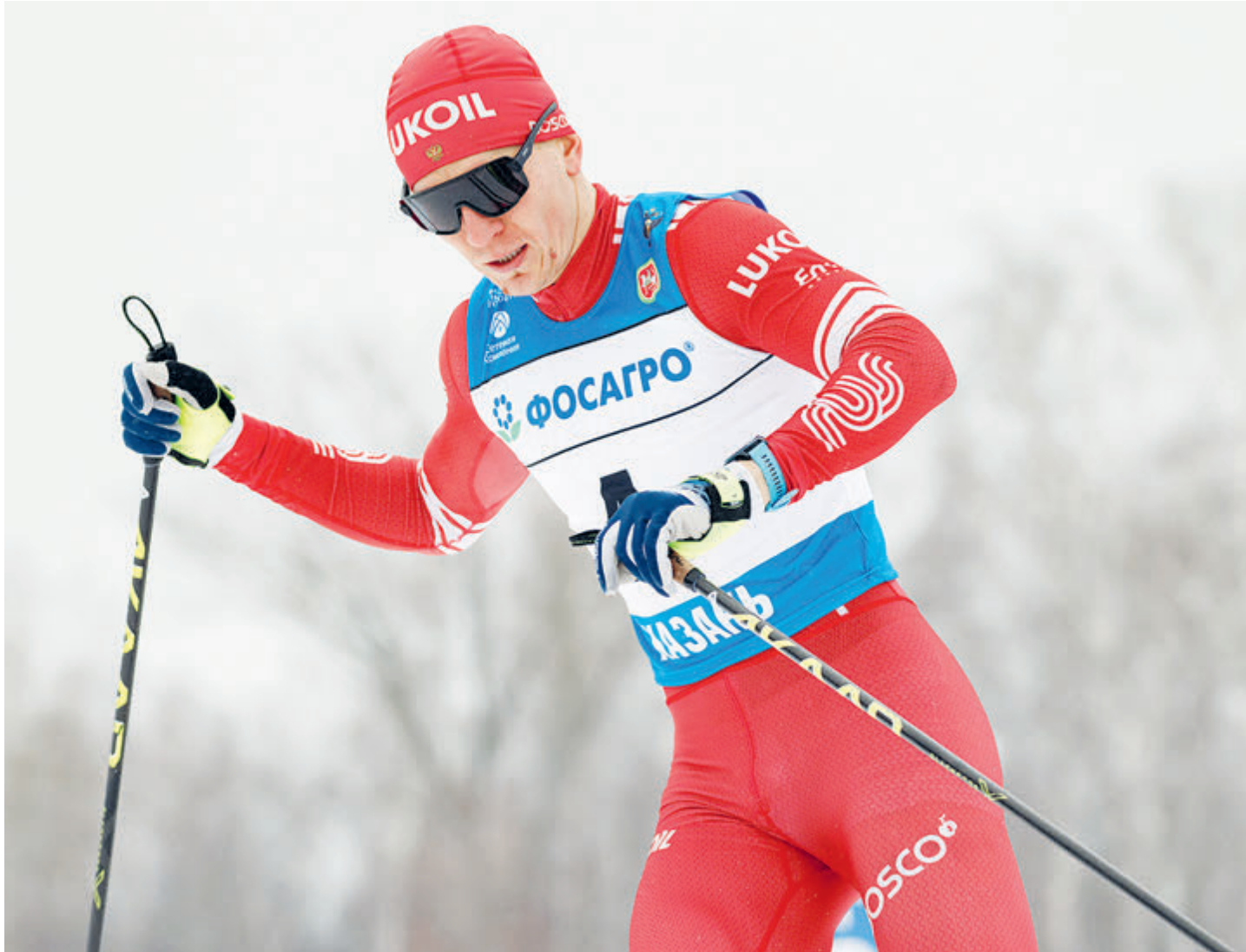
Александр Большунов на всякий случай начал готовиться к олимпийским гонкам – 2026.

Слова Вячеслава Фетисова насчет серых маечек, конечно, в большей мере