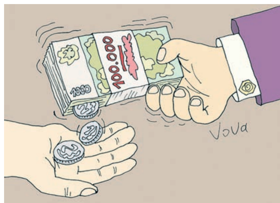
ИЛЛЮСТРАЦИЯ ВЛАДИМИРА ИВАНОВА / CARTOONBANK.RU

Между тем реальной экономии кешбэк практически не дает. Подавляющее большинство держателей таких карт получают совершенно не тот результат, на который рассчитывали. Виновата нехитрая уловка: вроде